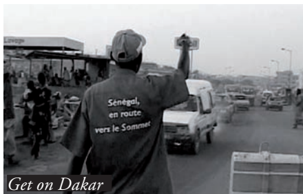
Get on Dakar