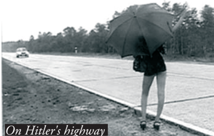
On Hitler's highway

La Californie ! État solaire aux sources de l'American Dream où chacun naïvement y voit les traces d'une réussite évidente. Lee Ann Schmitt va pourtant nous renvoyer très vite à une réalité moins utopique. La réalisatrice met en images les vestiges de ces villes industrielles devenues leurs propres fantômes. Il n'y a plus rien, les hommes sont partis, seul le sable fuit dans les rues, les maisons sont totalement abandonnées, les hôtels vides, les lieux de détente tristes, les routes désertiques... Une inquiétante étrangeté règne dans ces nombreuses villes éphémères, aujourd'hui simples natures mortes d'une réalité économique et politique ayant subi les effets du libéralisme et de la privatisation. Ce voyage, accentué par un sens évident du cadre et une gestion du temps dans l'image, crée un basculement, un état de malaise de plus en plus profond. Les voyages sous le soleil californien sont-ils tous beaux ? Il semble que les longues lignes droites de l'État américain le plus puissant du pays cachent les vestiges d'une réalité plus contemporaine.