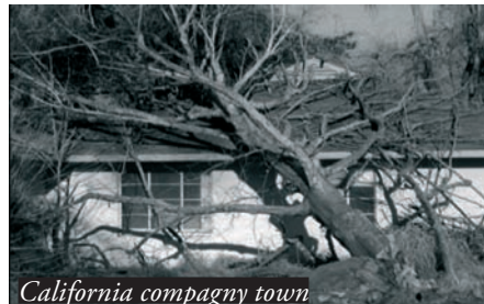
California compagny town